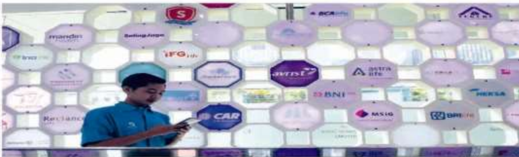
PENGUATAN EKUITAS: Asosiasi Asuransi Jiwa Indonesia (AAJI) menilai konsolidasi perusahaan BUMN berpotensi membuat struktur persaingan industri asuransi jiwa semakin dinamis. Danantara bakal merampingkan 15 perusahaan asuransi BUMN menjadi tiga entitas utama.

Judul Danantara Pangkas Asuransi BUMN Jadi Tiga Entitas Nama Media Jawa Pos Newstrend Halaman/URL Pg5 Tanggal Berita 2026-03-03 03:55 Sentiment Positive