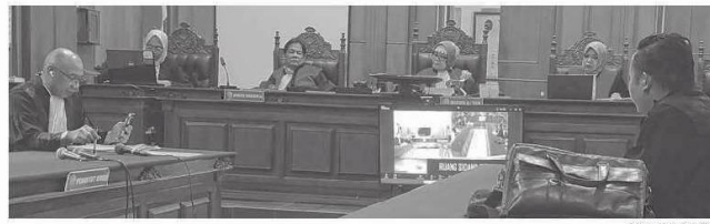
BEBER FAKTA: Jaksa penuntut umum membacakan surat dakwaan di PN Surabaya, Selasa (6/5).

Jaksa penuntut umum Yulistiono dalam dakwaannya menjelaskan, Darwin awalnya mengaku sebagai agen asuransi berpengalaman saat