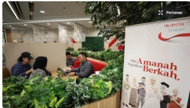
Karyawan Prudential Syariah melayani peserta saat hari pelanggan di Jakarta, Rabu (4/9/2024).