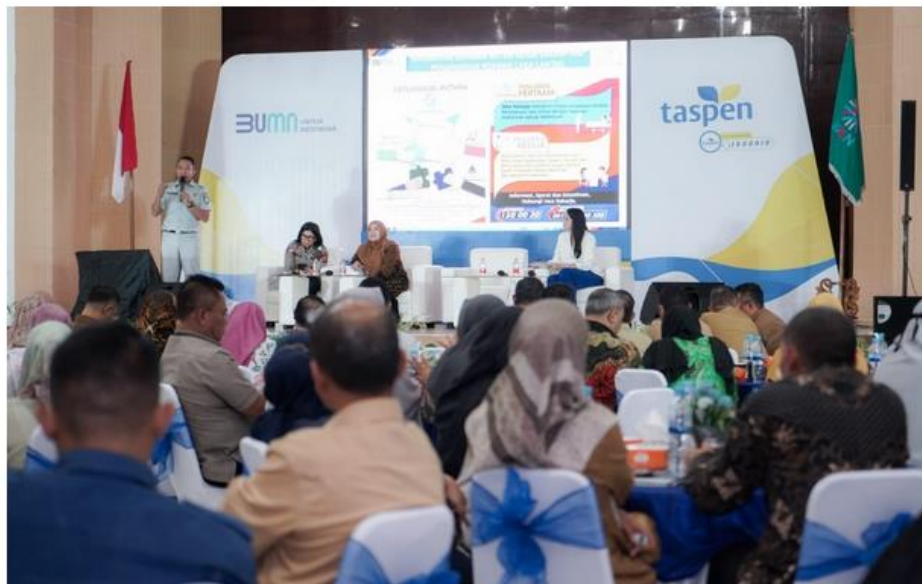
Taspen Safety Day, Sosialisasi Kesadaran K3 Bagi ASN di Sumut (Analisadaily/Istimewa)

🕒 Rabu, 09 Okt 2024 16:31 WIB 👁 1,075x 🔗 https://analisa.link/1056273/