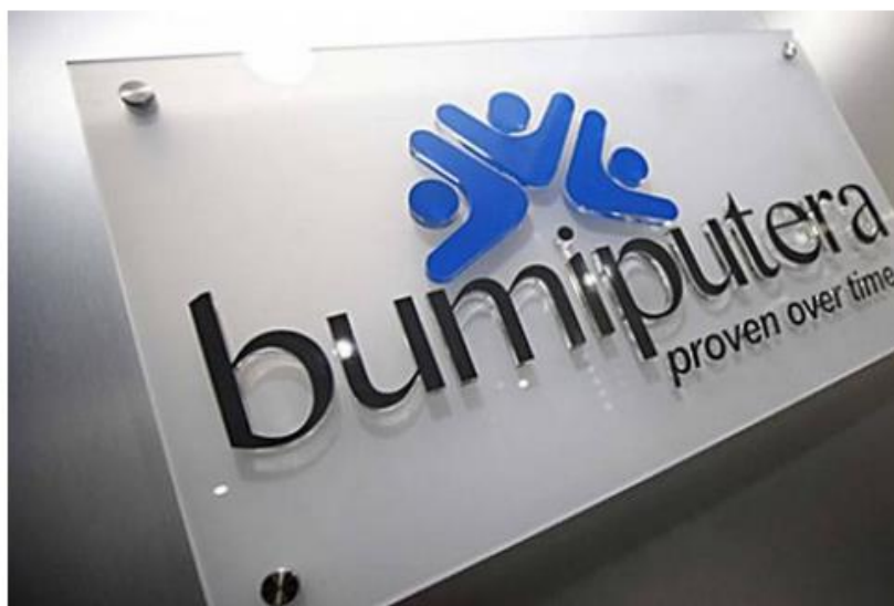
Otoritas Jasa Keuangan (OJK) masih memantau secara berkala proses klaim bagi nasabah pemegang polis AJB Bumiputera 1912.