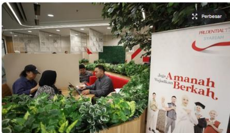
Karyawan Prudential Syariah melayani peserta di Jakarta, Rabu (4/9/2024).