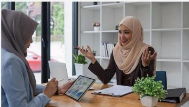
Ilustrasi pengajuan klaim asuransi.