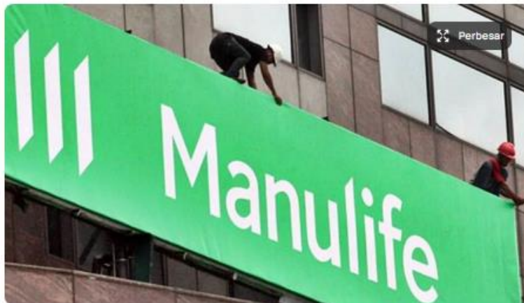
Pekerja menyelesaikan pemasangan banner PT Asuransi Jiwa Manulife Indonesia, di Jakarta, Selasa (22/11/2019).