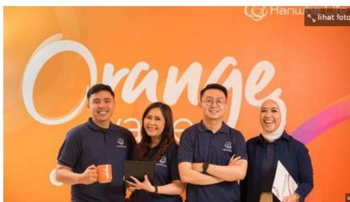
Semarak program Hanwha Friends Rewards Fiesta yang akan berakhir di 31 Oktober 2024 ini.

Penulis: Sri Handi Lestari | Editor: irwan sy