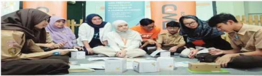
MASIH RENDAH: Program edukasi literasi keuangan menargetkan lebih dari 2.300 siswa sekolah menengah pertama.

Judul Literasi Keuangan Pelajar Masih Rendah Nama Media Radar Tarakan Newstrend Halaman/URL PgC4 Tanggal Berita 2026-02-10 09:46 Sentiment Positive