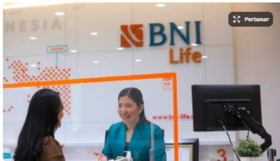
Karyawan melayani nasabah di kantor cabang PT BNI Life Insurance di Jakarta.