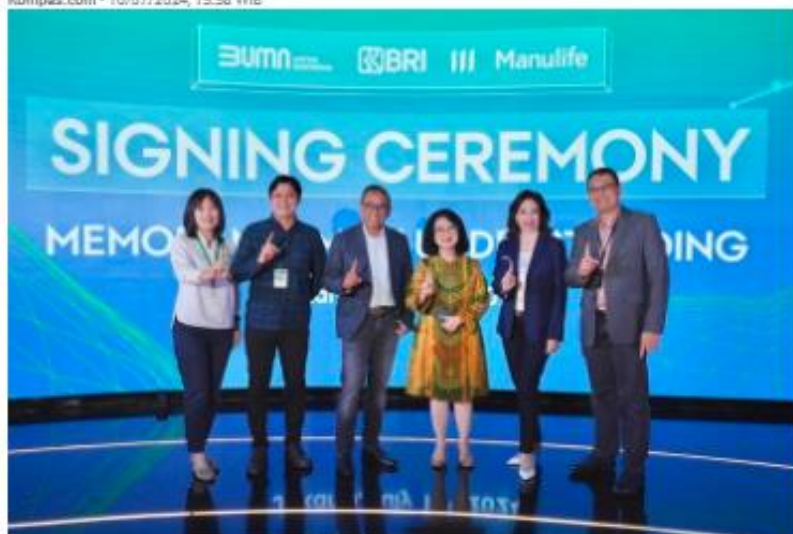
BRI dan Manulife Indonesia jalin kerja sama terkait pembayaran premi asuransi.