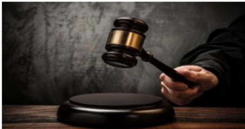
Denda dan sanksi Kresna life dinilai tepat

Ferida Syifa Anandita, Okezone · Rabu 10 Juli 2024 16:12 WIB