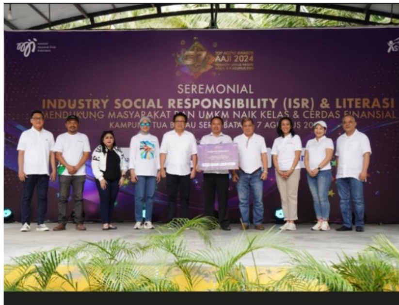
Dukung Kelestarian Lingkungan dan Pengembangan UMKM, AAJI Jalankan Program ISR dan Literasi di Batam

JagatBisnis.com – Asosiasi Asuransi Jiwa Indonesia (AAJI) kembali menunjukkan komitmennya terhadap lingkungan dan masyarakat melalui program Industry Social Responsibility (ISR) dan Literasi. Program ini merupakan bagian dari rangkaian acara Top Agen Awards yang ke-37. Acara bertema “Mendukung Masyarakat dan UMKM Naik Kelas & Cerdas Finansial” ini dilaksanakan di Desa Wisata Kampung Tua Bakau Serip, kota Batam .