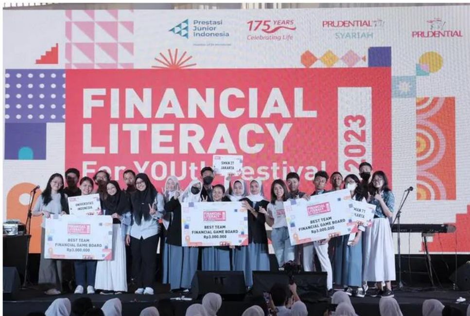
Financial Literacy For YOUTH Festival 2023

PT Prudential Life Assurance (Prudential Indonesia) membangun bisnis berkelanjutan dengan membawa pendekatan ESG (Environmental, Social, and Governance).