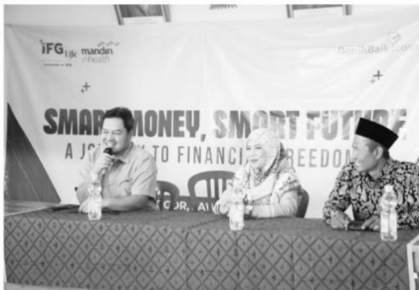
IFG Life dan Mandiri Inhealth berkolaborasi dengan BenihBaik.com menyelenggarakan kegiatan pelatihan pengelolaan keuangan bagi UMKM di Balai Desa Gunung Bunder 1, Kecamatan Pamijahan, Kabupaten Bogor, Jumat (9/8/2024).

"Kami sangat senang, karena pengetahuan dan informasi yang disampaikan, diharapkan memberikan pengetahuan bagi para pelaku UMKM dalam pengelolaan keuangan bagi keluarga maupun usaha," jelasnya.