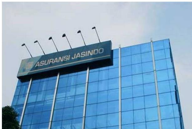
Ilustrasi: Kantor Pusat Jasindo.

law-justice.co - Dampak buruk korupsi nyata merusak perekonomian dan usaha di Indonesia. Salah satu BUMN Asuransi terpuruk hingga nyaris kolaps akibat praktik lancung di dalam korporasinya. PT Asuransi Jasa Indonesia (Persero) alias Jasindo mengalami kesulitan keuangan pada 2020-2021 karena korupsi hingga menjadi pasien OJK. Kini, Komisi Pemberantasan Korupsi (KPK) terus mengusut kasus-kasus korupsi di Jasindo, setelah sebelumnya mantan Dirut dan Direksinya dibui untuk kasus serupa.