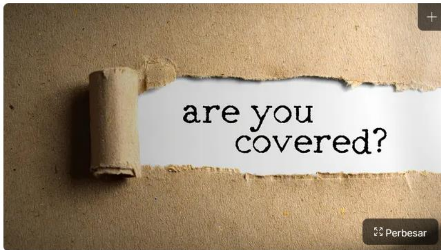
Ilustrasi asuransi

Liputan6.com, Jakarta - Inflasi medis kini memberikan dampak konkret bagi bisnis Asuransi Indonesia. Tembus dua digit, inflasi medis saat ini mencapai 11,5 %.