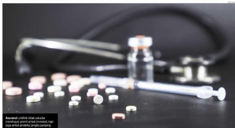
Asuransi unitlink tidak sekedar membayar premi untuk investasi, tapi juga untuk proteksi jangka panjang.