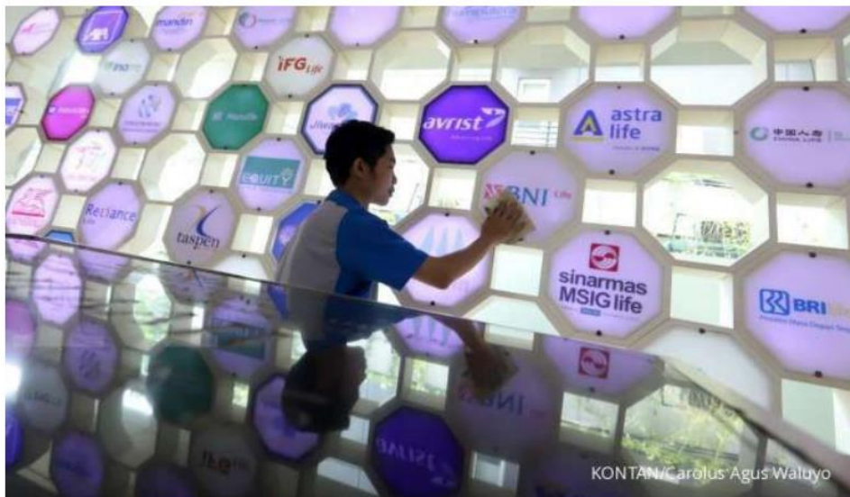
ILUSTRASI. OJK telah mengeluarkan Peraturan Otoritas Jasa Keuangan (POJK) Nomor 11 Tahun 2024.