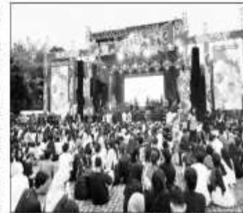
SAKSI/OKKALUMAH/RAKONALISTIKO SAMPOERNA FEST- Bank Sampoerna menggelar Sampoerna Fest di Sam Poo Kang Semarang, pada Sabtu (9/11/2024).

Selain penampilan musisi papan atas, Bank Sampoerna juga memiliki kepedulian terhadap musisi lokal yang ada di kota Semarang. Melalui program "Sampoerna Fest: Band Subnasional", Bank Sampoerna memberikan kesempatan bagi musisi lokal untuk dapat menunjukkan kemampuan musik dan memberikan wadah yang lebih besar untuk mempromosikan hasil karya mereka di tingkat nasional. Dari puluhan band