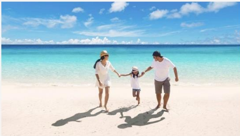
Ilustrasi keluarga terlindungi Asuransi Aurora. (Dok: Ist)

Follow Suara.com untuk mendapatkan informasi terkini. Klik WhatsApp Channel & Google News