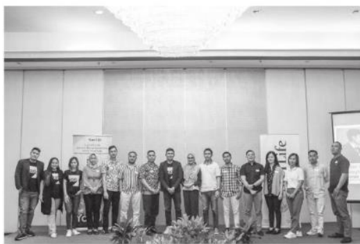
BERSAMA: Sejumlah peserta yang mengikuti Program 'Color You Up' di Kota Bandung, berfoto bersama.

"Tidak hanya sesi pelatihan bersama profesional terkemuka, di program ini pun pihaknya juga membuka kesempatan eksklusif bagi generasi muda yang ingin membangun karier di industri bancassurance untuk bergabung dengan Sun Life Indonesia sebagai Insu-