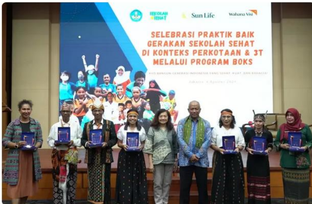
Sun Life Indonesia tumbuhkan kesadaran anak-anak agar memiliki kebiasaan hidup sehat sejak dini.

Ferdy Christian · Senin, 12 Agustus 2024 - 23:59 WIB