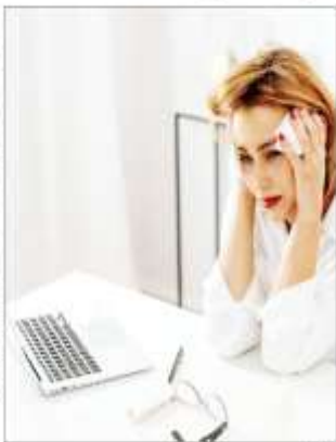
Ilustrasi Generasi X, Y, dan Z.

Dalam survei bertajuk FWD consumer outlook survey ini, FWD Group Holdings Limited berkolaborasi dengan lembaga survei, Ipsos. Riset itu mengkaji kesejahteraan finansial, kekhawatiran, serta kesenjangan perlindungan