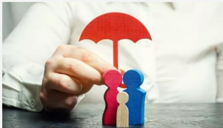
Ilustrasi asuransi (Elements Erwato)