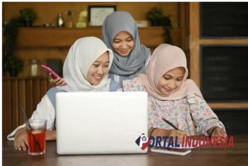
Asuransi Jiwa Syariah PRUCinta

Asuransi jiwa syariah adalah langkah penting dalam perencanaan keuangan yang bertujuan untuk melindungi keluarga dari risiko keuangan yang tidak terduga. Perlindungan ini menjadi semakin krusial terutama jika Anda sudah berkeluarga.