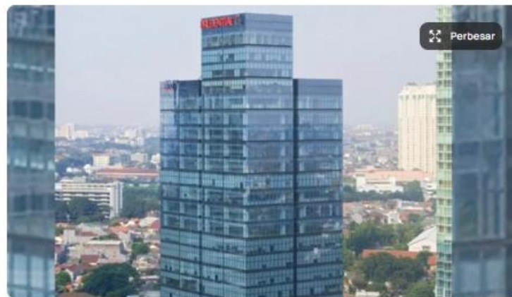
Ilustrasi gedung Prudential Indonesia.