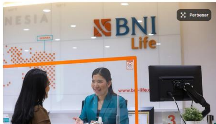
Karyawan melayani nasabah di kantor cabang PT BNI Life Insurance di Jakarta.