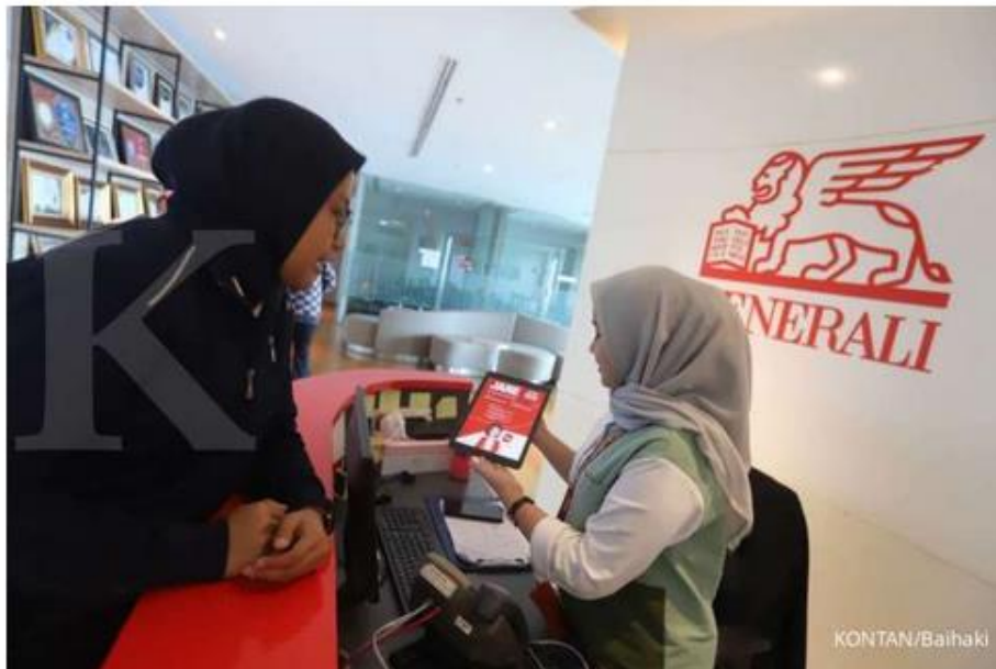
ILUSTRASI. 30 perusahaan asuransi yang berencana melakukan pemisahan unit usaha syariah.

Reporter: Nadya Zahira | Editor: Handoyo .