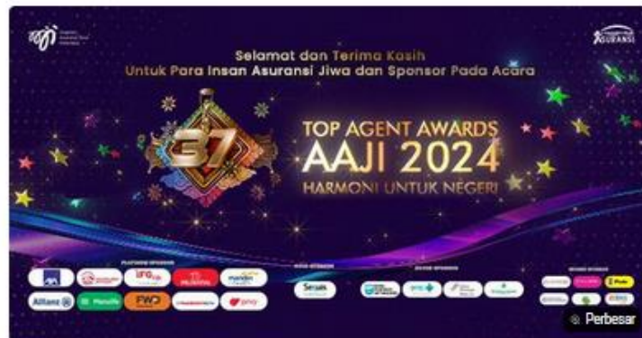
Asosiasi Asuransi Jiwa Indonesia memberikan penghargaan kepada perusahaan maupun tenaga pemasar Top Agent Awards AAJI 2024.