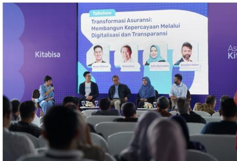
Rampungkan Akuisisi, Kitabisa Hadirkan Layanan Asuransi Jiwa Syariah

Asuransi Kitabisa membawa pendekatan baru dalam industri asuransi dengan menekankan semangat tolong-menolong.