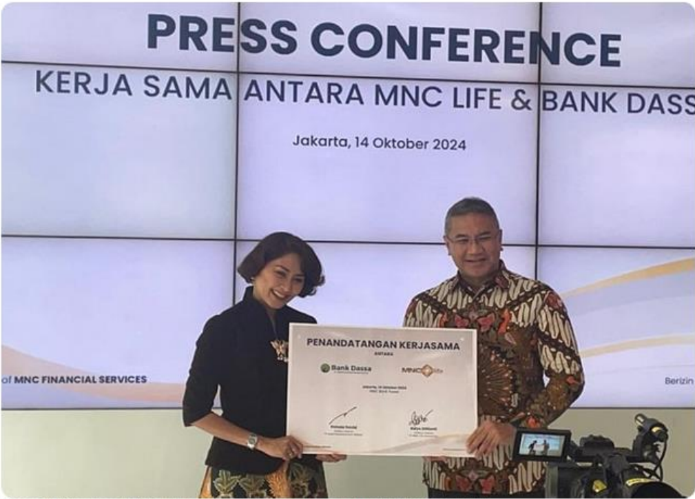
Kolaborasi Bank Dassa dengan MNC Life untuk memberikan perlindungan menyeluruh kepada nasabah.