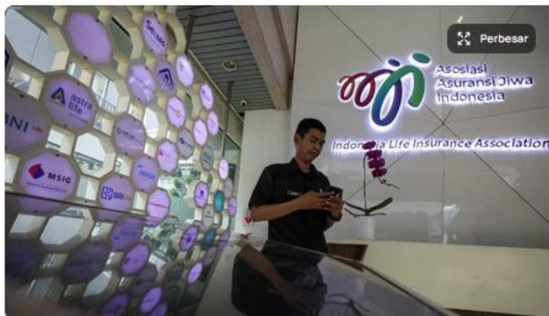
Karyawan beraktivitas di kantor Asosiasi Asuransi Jiwa Indonesia (AAJI), Jakarta, Selasa (8/10/2024).