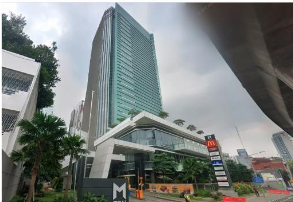
Tangkapan layar Kantor Orion Reasuransi. /Google Street.

A+ Bisnis, JAKARTA — Persaingan industri reasuransi bakal semakin ketat. PT Orion Reasuransi Indonesia atau Orion Reasuransi resmi mendapatkan izin usaha Otoritas Jasa Keuangan (OJK).