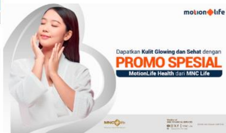
Promo perawatan kulit dari MotionLife Health, (Foto: MNC Life)

Tim Okezone, Okezone · Rabu 17 April 2024 13:24 WIB