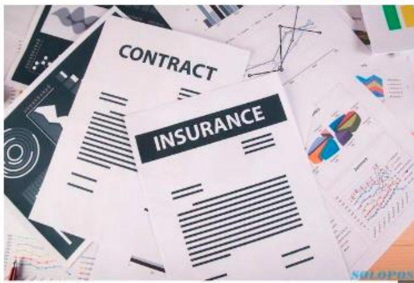
Asuransi Unit Link