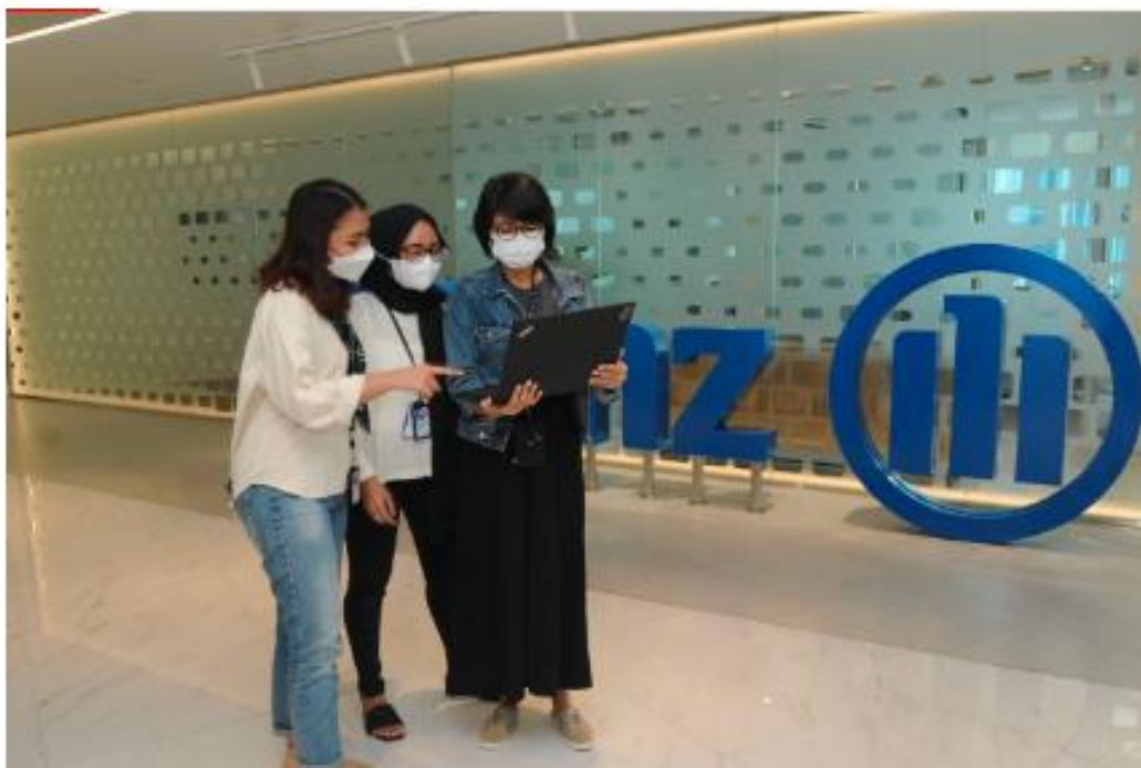
Kebutuhan meyakini terhadap asuransi akan selalu ada walaupun dibarengi kondisi ekonomi dan politik yang ada.

DY ANGGA BRATADHARMA RABU, 17 APRIL 2024 17:45 WIB