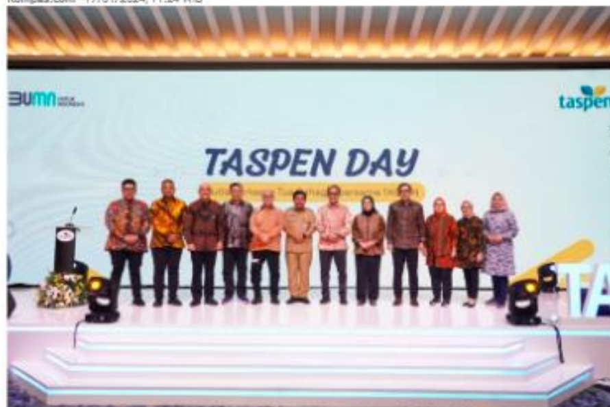
Taspen Day 2024.