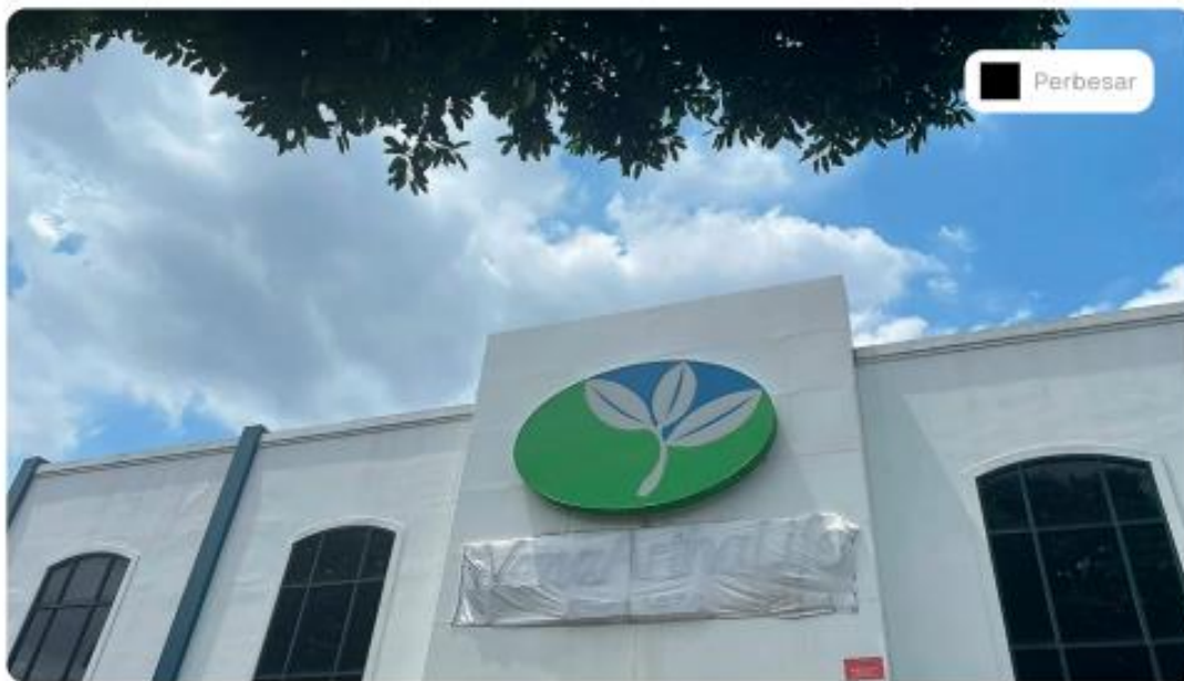
Keadaan Kantor Wanaartha Life pasca OJK mencabut izin usaha, Senin (9/1/2023).