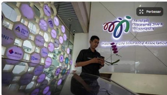
Karyawan beraktivitas di kantor Asosiasi Asuransi Jiwa Indonesia (AAJI), Jakarta, Selasa (8/10/2024).