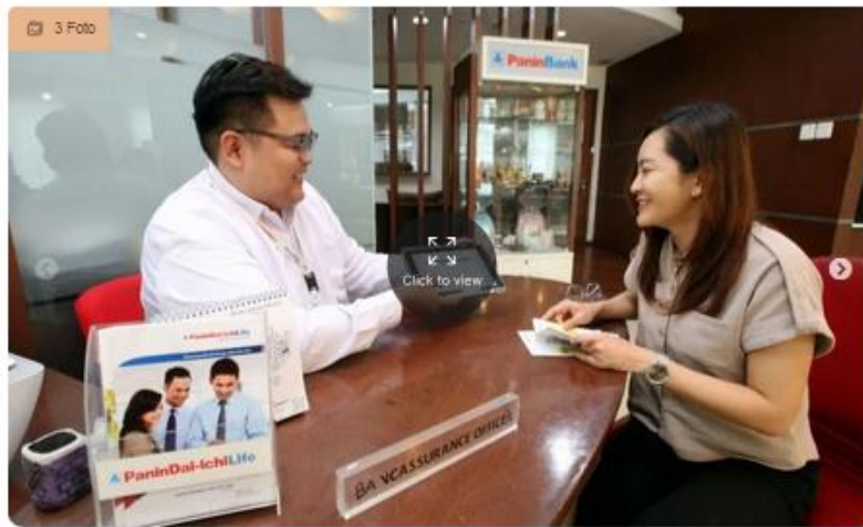
PT Panin Dai-ichi Life, melakukan pembayr and klaim tutup usia sebesar Rp2,4 miliar kepada ahli waris Nasabah Bancassurance di Bandung, Jawa Barat.