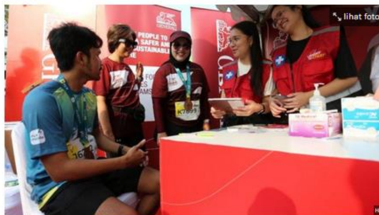
PLN Electric Run 2024 memberikan perlindungan kepada 6.000 pelari yang terbagi menjadi 3 kategori: 5 kilometer, 10 kilometer, dan 21 kilometer.

Penulis: Husna Fadilla Tarigan | Editor: Ayu Prasandi