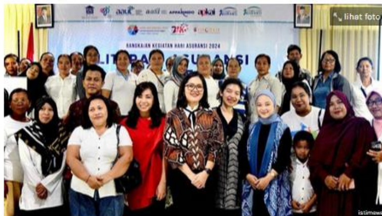
PT Prudential Life Assurance (Prudential Indonesia) berkolaborasi dengan Dewan Asuransi Indonesia (DAI) menyelenggarakan program "Literasi Asuransi untuk Negeri".

Penulis: Ni Luh Putu Wahyuni Sari | Editor: Ida Ayu Made Sadnyari