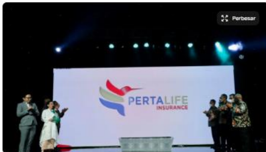
Peluncuran asuransi PertaLife.