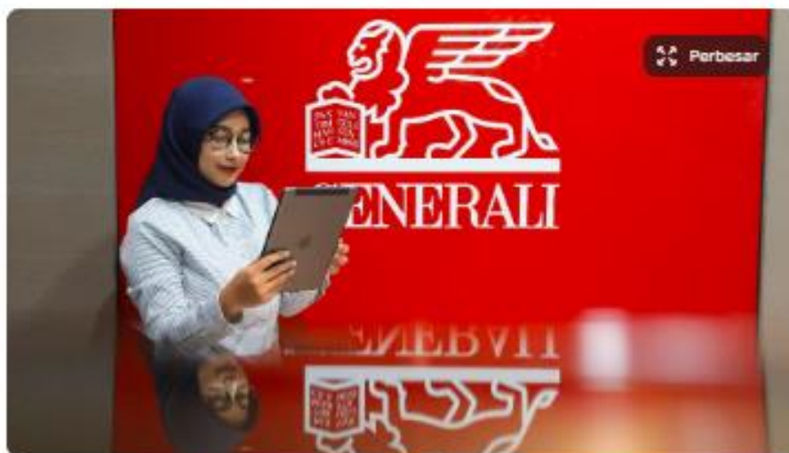
Pegawai beraktivitas di kantor cabang Generali Indonesia, Jakarta, Selasa (5/3/2024).