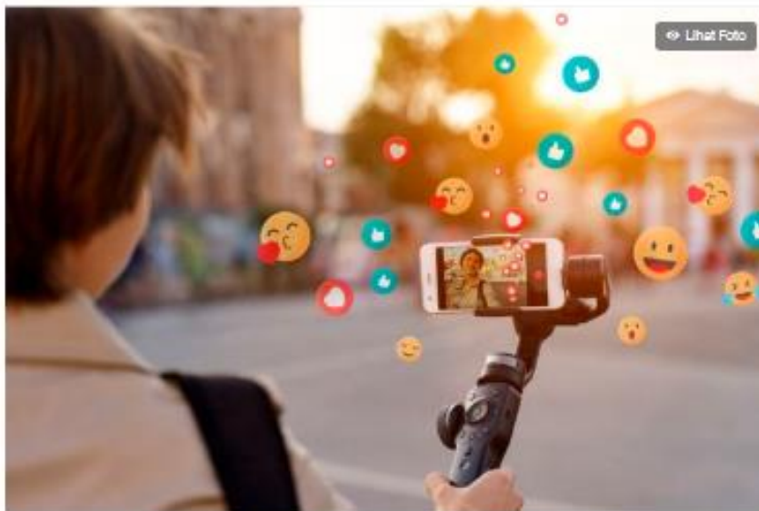
Ilustrasi gen Z.