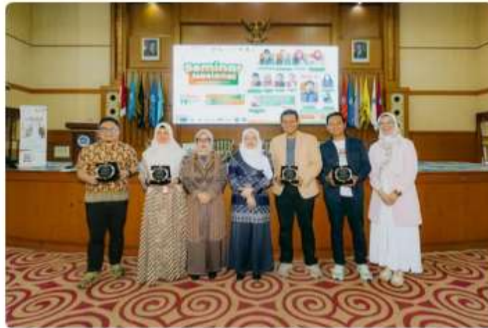
Prudential Syariah dan UIN Syarif Hidayatullah gelar seminar Literasi Keuangan Syariah di Aula Harun Nasution UIN Syarif Hidayatullah Jakarta pada 13 November 2024. (W.)

KORAN GALA - Prudential Sharia Life Assurance ( Prudential Syariah ) terus menunjukkan komitmen dalam mendukung peningkatan literasi keuangan dan asuransi syariah di Indonesia.