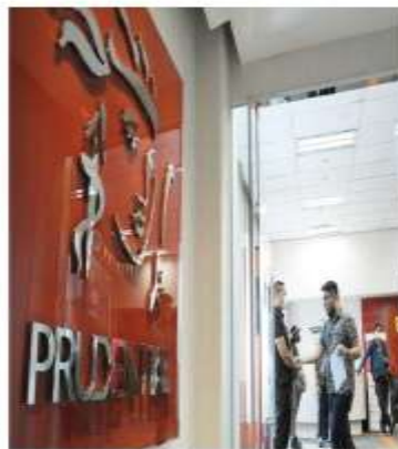
PT Prudential Life Assurance (Prudential Indonesia) mencatatkan hasil kinerja yang positif sepanjang kuartal III/2024.

"Kami berterima kasih atas kepercayaan para nasabah, tenaga pemasar, dan seluruh pihak sehingga kinerja Prudential Indonesia tetap solid hingga kuartal III/2024. RBC Perusahaan yang senantiasa kami