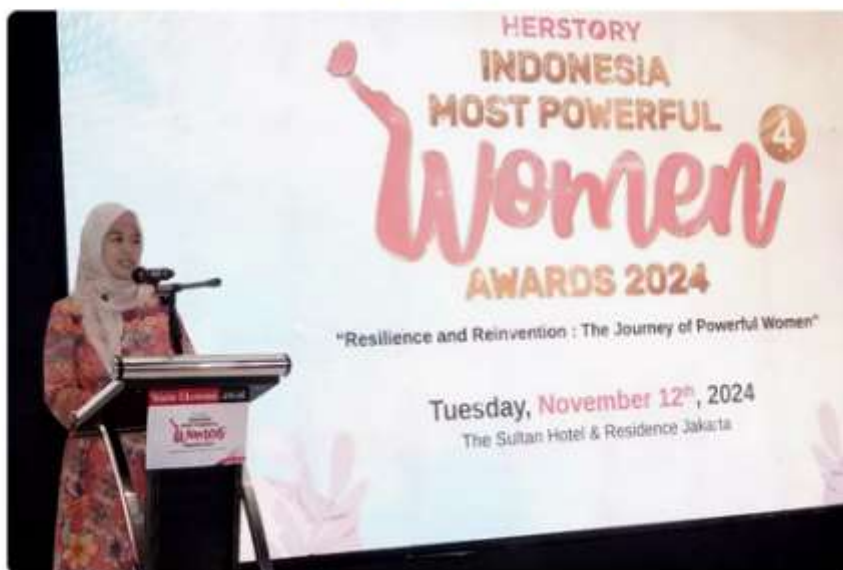
Peraih Indonesia Most Powerful Women Awards 2024.

Hops.ID - Penelitian Women in Business 2024 di 29 negara menjelaskan bahwa terjadi kenaikan signifikan terhadap jumlah persentase anggota dewan direksi dan manajer perempuan sebesar 33,5% di tahun 2024 ini.