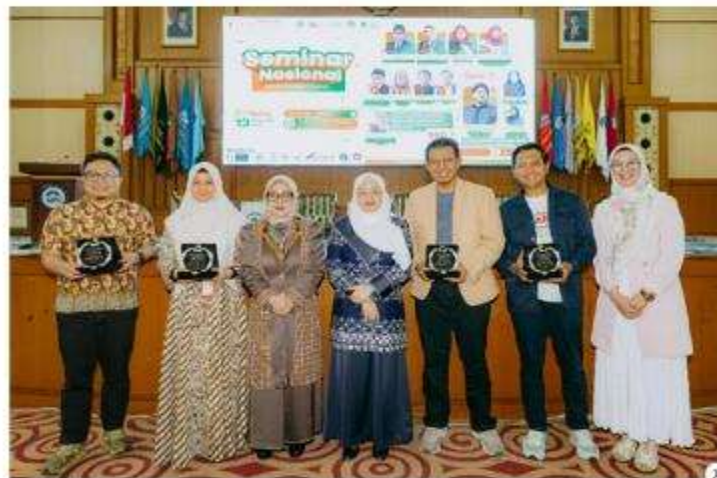
seminar yang digelar Prudential Syariah bekerja sama dengan UIN Syarif Hidayatullah Jakarta.

RADAR BOGOR —PT Prudential Syar Life Assurance ( Prudential Syariah ) terus berkomitmen untuk meningkatkan pengetahuan masyarakat tentang asuransi syariah dan keuangan di Indonesia.