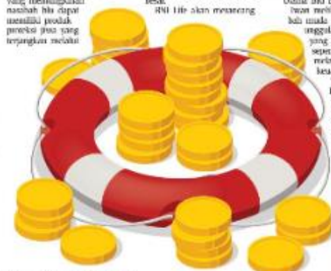
Total Polis Asuransi Jiwa (Juta Polis)

"Kalau yang muda, mereka lebih dinamis dan suka berinovasi juga berbeda (tentang asuransi dan terhadap nasabah)," ujarnya. □