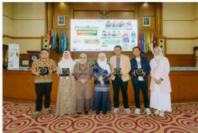
PT Prudential Sharia Life Assurance (Prudential Syariah) terus memperkuat komitmennya dalam mendukung peningkatan literasi keuangan dan asuransi syariah di Indonesia.