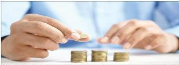
MENINGKAT: Aset industri asuransi pada Desember 2024 mencapai Rp 1.133,87 triliun, meningkat 2,08 persen dibandingkan tahun sebelumnya.

Judul Aset Industri Asuransi Capai Rp 1.133,87 T Nama Media Kaltim Post Newstrend Halaman/URL Pg13&amp;16 Tanggal Berita 2025-02-21 08:04 Sentiment Positive