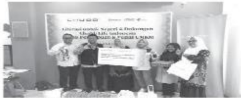
DOMPET Dhuafa menggelar pelatihan literasi keuangan dan pengembangan UMKM

di bawah tema besar GENCAH-KAN (Gerakan Nasional Cerdas Keuangan) yang diinisiasi oleh Menteri Jasa Keuangan (MJK) untuk meningkatkan indeks literasi keuangan di Indonesia.