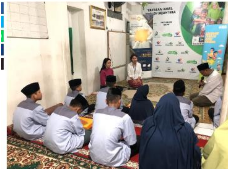
MNC Life dan MNC Peduli donasikan buku ke penti asuhan.

Syifa Fauziah, Okezone · Senin 20 Mei 2024 23:53 WIB