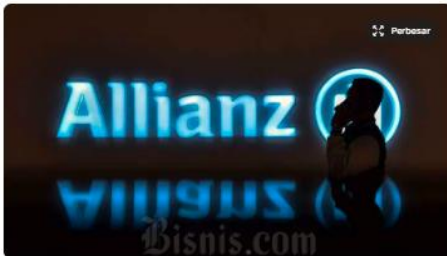
Nasabah beraktivitas di kantor Allianz di Jakarta.