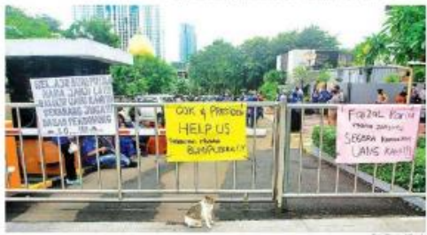
Protes terhadap masalah yang berakibat rusaknya kantor AJB Bumiputera 1912 di Jakarta, beberapa waktu lalu.