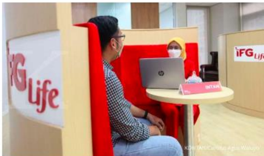
ILUSTRASI: Karyawan IFG Life melayani nasabah visi peremasan Customer Center yang berlokasi di Gedung Graha Negeri, Jakarta, Rabu (24/11).