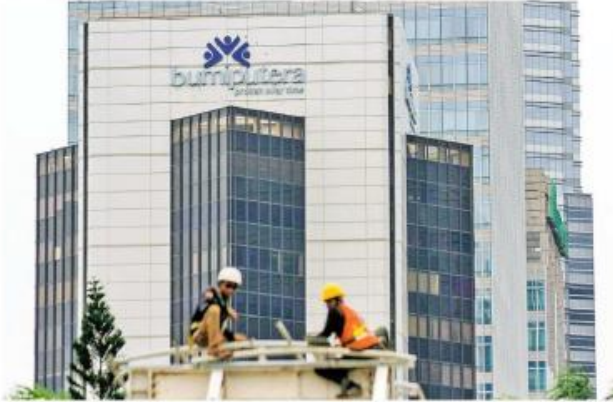
Pekerja beraktivitas dengan latar belakang gedung AJB Bumiputera 1912 di Jakarta.