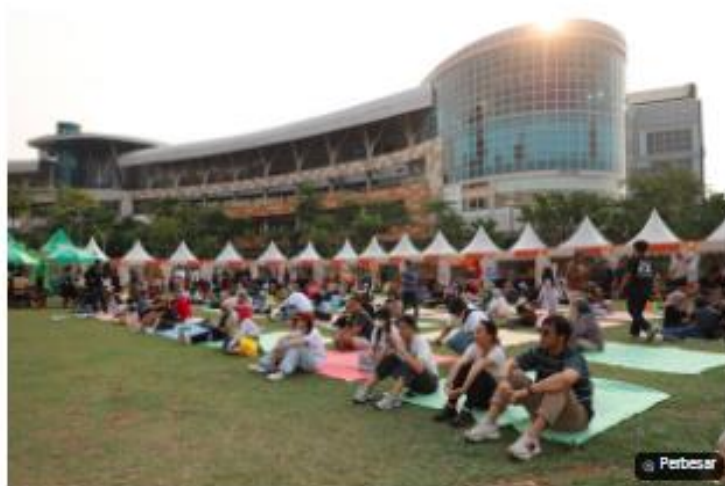
Keseruan di Pesta Nasgor 2024.