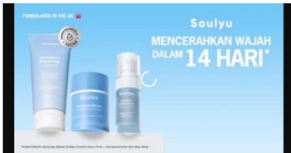
MNC Life Raih Penghargaan di Ajang The Finance Executive Forum.

Penghargaan ini diberikan atas prestasi MNC Life yang berkomitmen dalam memberikan layanan terbaik dan inovasi dalam bisnis asuransi.