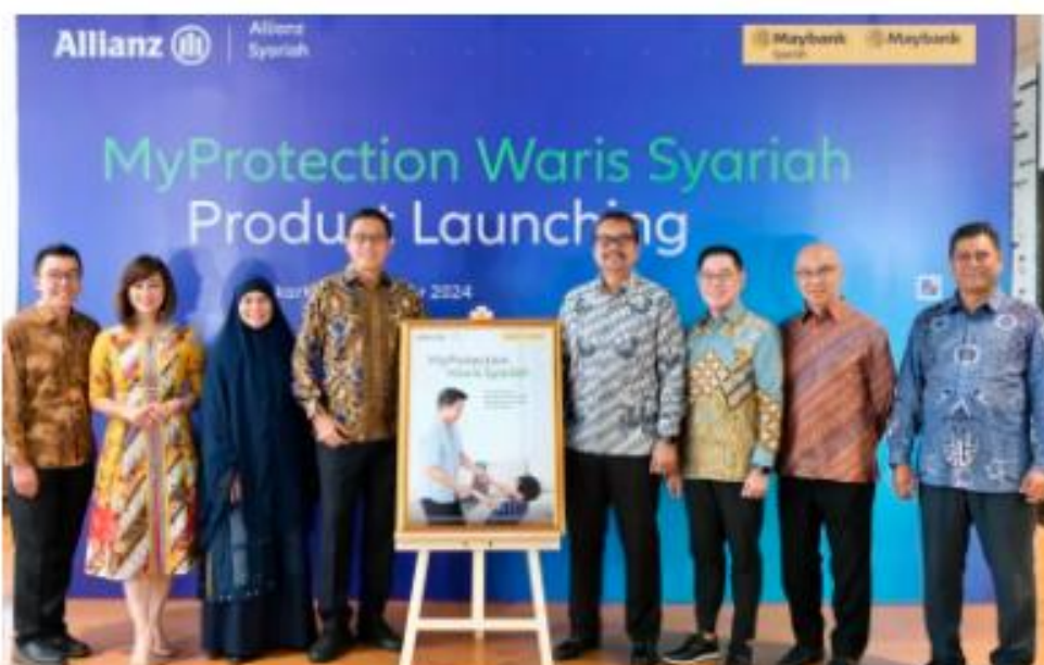
Allianz Syariah gandeng Maybank Indonesia untuk memperkenalkan MyProtection Waris Syariah.

Allianz Syariah gandeng Maybank Indonesia untuk memperkenalkan MyProtection Waris Syariah.