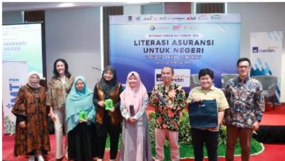
AXA Mandiri Edukasi Pelaku UMKM di Semarang Pentingnya Miliki Asuransi /

PR Semarang - PT AXA Mandiri Financial Services (AXA Mandiri) kembali mengkokohkan komitmennya sebagai mitra perlindungan kesehatan dan keuangan masyarakat dengan menggelar sejumlah kegiatan literasi keuangan dan kesehatan di Semarang, Jawa Tengah bertajuk 'Literasi Asuransi untuk Negeri'.