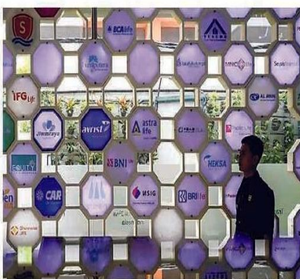
DUA TAHAP: Berbagai logo perusahaan asuransi di kantor Asosiasi Asuransi Jiwa Indonesia (AAJI), Jakarta. OJK telah mengeluarkan peraturan ekuitas minimum yang harus dipenuhi perusahaan asuransi dan reasuransi, baik konvensional maupun syariah.

Kepala Eksekutif Pengawas Perasuransian, Penjaminan, dan Dana Pensiun (PPDP) Ogi Prastomiyono menyatakan bahwa target ekuitas