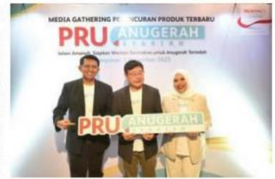
MELUNCURKAN PRODUK - PT Prudential Sharia Life Assurance (Prudential Syariah) meluncurkan PRUAnugerah Syariah.

Prudential Syariah telah dipercaya oleh lebih dari 11.000 peserta di Bali dan menyalurkan manfaat klaim dengan total sebesar Rp16,9 miliar untuk peserta lain yang membutuhkan. "PRUAnugerah Syariah adalah produk asuransi jiwa Syariah yang dapat membantu keluarga Indonesia mempersiapkan warisan secara cerdas. Kami juga berharap dapat terus mendukung keluarga Indonesia untuk memiliki akses proteksi dalam Jalani Amanah Siapan Warisan Bermakna untuk Anugerah Terindah," tutup Paul. (ad015)