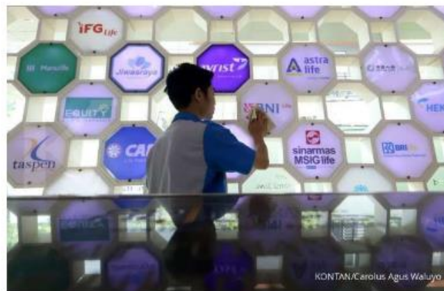
ILLUSTRASI: Sejumlah perusahaan asuransi jiwa di Tanah Air yang memiliki produk asuransi mikro mencatat adanya peningkatan jumlah nasabah.

Reporter: Arif Ferdianto | Editor: Handoyo .