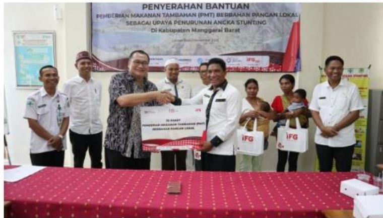
Penyerahan 75 Paket Makanan Tambahan kepada anak di 5 desa dan Kelurahan di Kabupaten Manggarai Barat.

LABUAN BAJO | patrolipost.com – Indonesia Financial Group (IFG) bersama anggota Holding jelang gelaran IFG Labuan Bajo Marathon 2023 memberikan bantuan tanggung jawab sosial dan lingkungan (TJSL) berupa paket Pemberian Makanan Tambahan (PMT) berbahan pangan lokal untuk membantu stunting anak di 5 desa dan kelurahan di Manggarai Barat. Lima desa, yaitu Desa Pasir Putih (Pulau Mesah), Desa Papagarang, Desa Pulau Komodo, Kelurahan Wae Kelambu, dan Kelurahan Labuan Bajo.