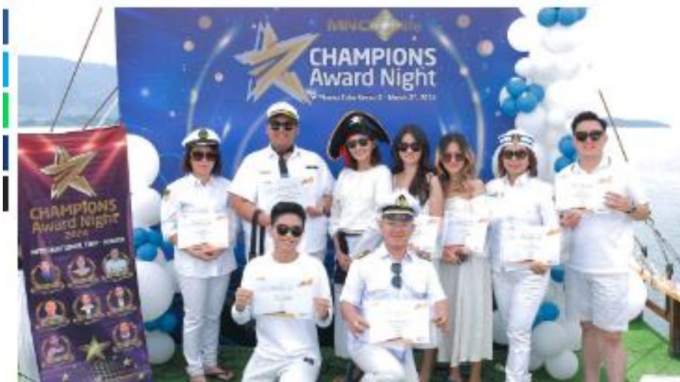
MNC Life Apresiasi Mitra Penjual Melalui Champion Award Night 2024

Nurul Amirah Neoution , Okezone · Selasa 05 Maret 2024 10:51 WIB