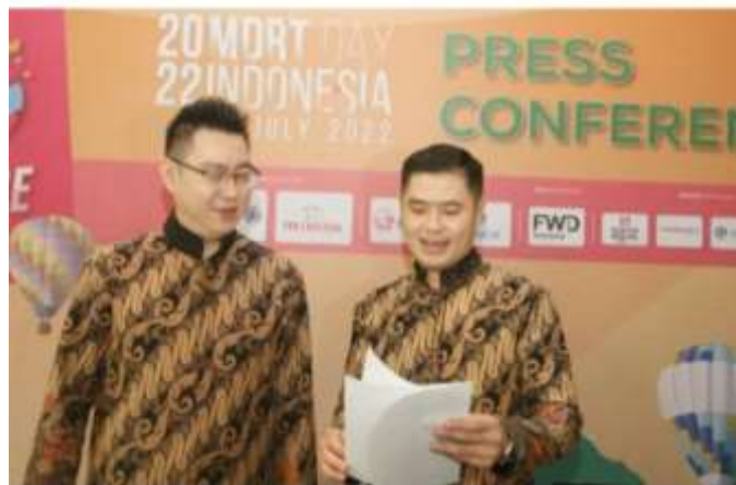
Jumpa pers MDRT Indonesia di Jakarta, Kamis (28/7).

JawaPos.com – Kebijakan industri asuransi jiwa di tanah air menjual produk yang mengcover Pandemi Covid-19 mendapat apresiasi global. Selain nasabah lokal, produk ini pun diminati warga negara tetangga, seperti Singapura.