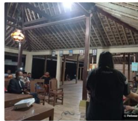
Selasa, 12 April 2022. Kegiatan Sosialisasi Asuransi Kesehatan di Desa Dusun Nglanggeran Wetan, Kabupaten Gunungkidul.

Tulisan dari RIO DOMINIQUE Q PUTRA tidak mewakili pandangan dari redaksi kumparan