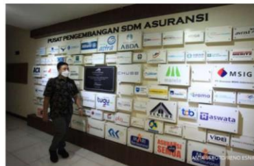
©2022 KONTAN. All rights reserved. © Desain logo logo perusahaan asuransi. #KONTANKONTANKONTAN