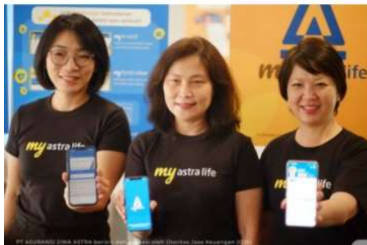
Astra Life Luncurkan Aplikasi MyAstraLife